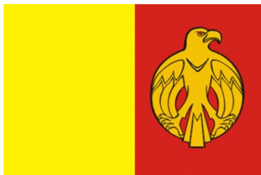
Прапор Кіровоградської області